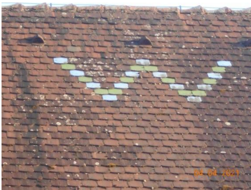
12. "Wer weiß denn sowas..."