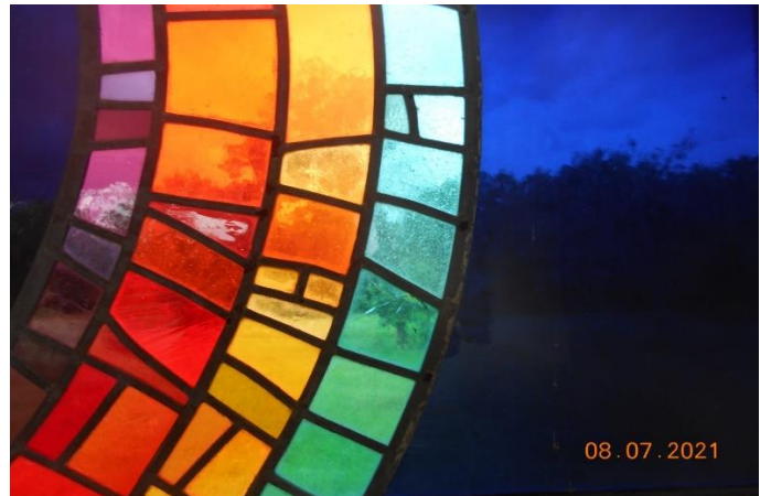
11. "...somewhere over the rainbow" (Judy Garland)