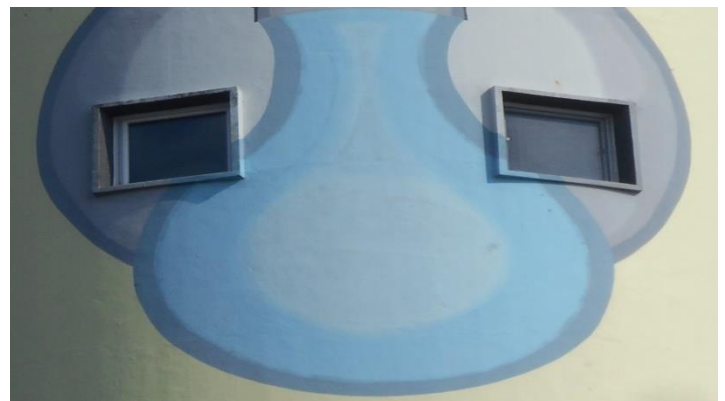
7. "...Codo der dritte, aus der Sternenmitte bin ich der dritte von links" (DÖF)