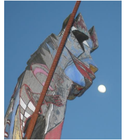
3. (unnützes Wissen) Der Mond ist der einzige Himmelskörper den wir im Lauf eines Lebens wandernd erreichen könnten. 384 000 km sind zu Fuß machbar, aber wenn Sie sich daran erinnern, wie anstrengend die Bahntour Olnhausen - Jagsthausen war, bleiben Sie lieber da.