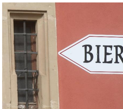
5. "Das gute am Bier ist, dass man es von 11.00 Uhr morgens bis zum Frühstück trinken kann." (Klaus Augenthaler, Fußballer)