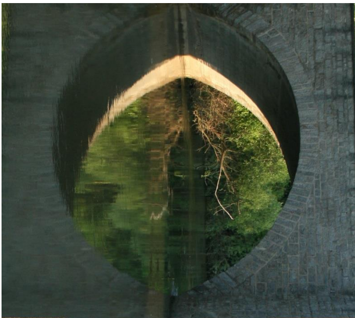
6. "Hinter'm Horizont geht's weiter..." (Udo Lindenberg)