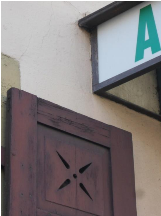
8. "Yesterday..." (Beatles)