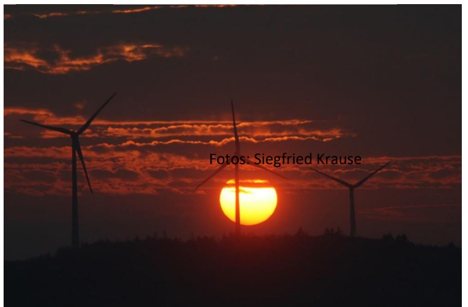
13. "...heiliger Gott, wie blutrot der Himmel ist, die untergehende Sonne..." (Götz von Berlichingen, 5. Akt)