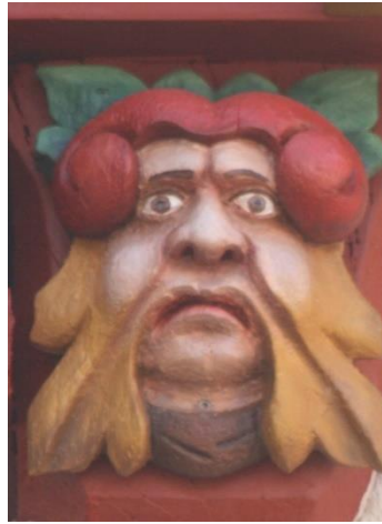
2. "I'm just a lonely boy" (Paul Anka)