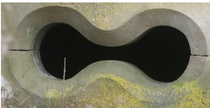
4. Die liegende acht, Symbol der Unendlichkeit