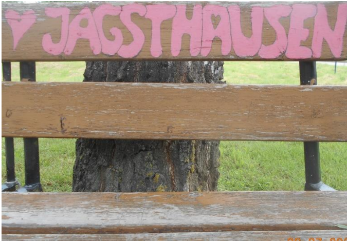
1. ... eine liebenswerte Gemeinde