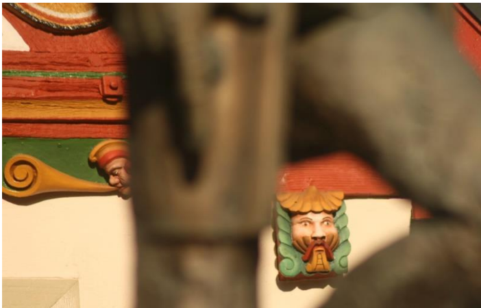
10. "Das machen nur die Beine von..." (Gerhard Wendland)